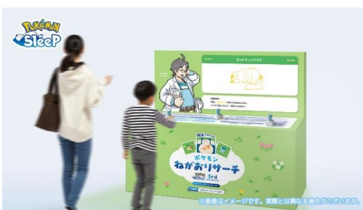
※スタンプラリー台 イメージ