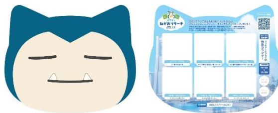
※スタンプラリー台紙 イメージ