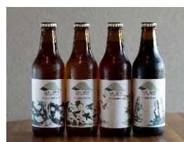
うきはバレー醸造所