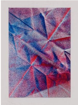
小牟田悠介 《Unfolded #40》2023