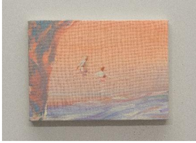
安田悠 《Recall 24-01》2024 ©yuyasuda