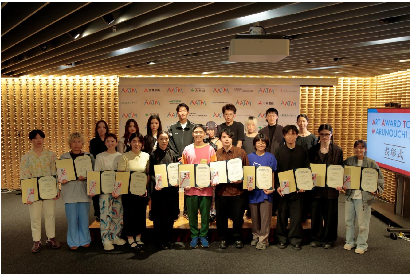
各受賞者含め参加した 20 名のアーティスト

AATMは20回目の開催を迎え、今年も 全国18校からノミネートされた200点の作品より、厳選した20作品を展示 。開幕日の5月25日（月）には、20作品の中からグランプリ、審査員賞など各賞を決定・発表し、表彰式を行いました。