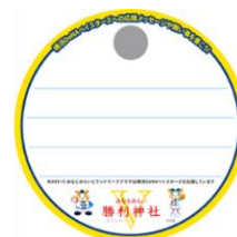
限定デザイン必勝祈願絵馬(イメージ)