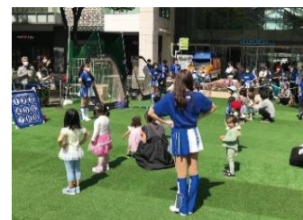
イベントの様子(イメージ)