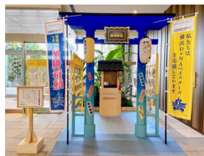
みなとみらい勝利神社

【配布場所】 MARK IS みなとみらい 1階 グランドギャラリー みなとみらい勝利神社