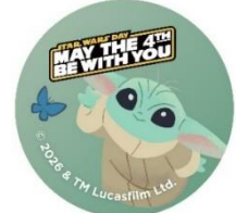
※缶バッジイメージ