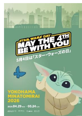
キービジュアル(グローグー)

ランドマークプラザ 1階のサカタのタネ ガーデンスクエアでは、歴代シリーズの名シーンや、大人気キャラクターなど、スター・ウォーズの銀河が、 巨大な空間に浮かび上がるホログラム映像 を投影。左右の窓の向こうに広がる銀河には、数々のスターシップが飛び交い、壮大な冒険へと誘います。さらに、ランドマークプラザ3階の風の灯台前には、ウェルカムスポットとして「グローグー」と「マンダロリアン」のスタチューを展示します。