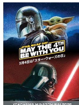
キービジュアル(Star Wars Day)

ランドマークプラザ、MARK IS みなとみらい(神奈川県横浜市/運営:三菱地所プロパティマネジメント株式会社)は、ウォルト・ディズニー・ジャパン株式会社の協力のもと、2026年4月29日(水・祝)~5月24日(日)の約1か月間、横浜・みなとみらいエリアにて、「 STAR WARS DAY YOKOHAMA MINATOMIRAI 2026 」と題したゴールデンウィークのイベントを実施いたします。1977年の映画全米公開以来、全世界を興奮と歓喜で満ち、社会現象を巻き起こし続けてきた空前のエンターテインメント「スター・ウォーズ」。今年は約7年ぶりの新作映画『スター・ウォーズ/マンダロリアン・アンド・グローグー』の公開を5月22日(金)に控える中、ゴールデンウィーク期間中の5月4日(月・祝)は、「May the Force be with you.(フォースと共にあらんことを。)」というスター・ウォーズの名台詞にちなんだ「スター・ウォーズの日 ※2 」として記念日に制定されていることもあり、 みなとみらいでの3回目の開催となる今年は 、さらなる盛り上がり期待されます。