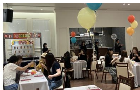
▲サマーパーティ開催時の様子