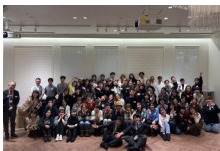
▲テナント従業員懇親会開催時の集合写真と懇親会時に実施したテナント表彰