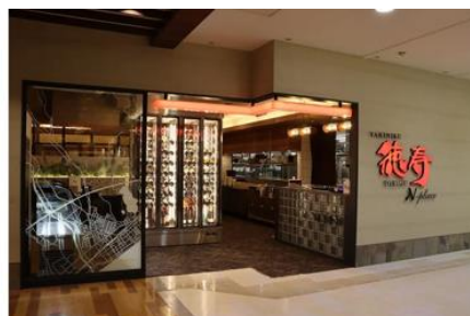
▲2025 年 12 月開業の「焼肉徳寿」