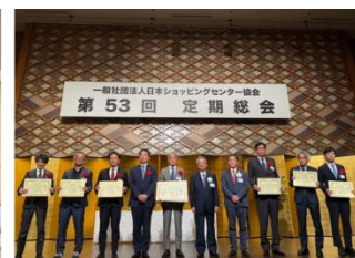
▲地域貢献賞授賞式の様子