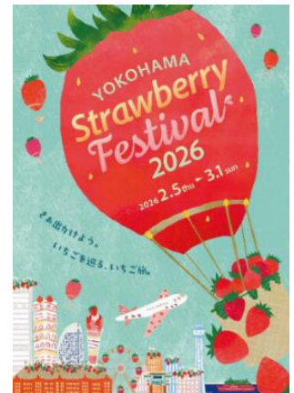
「Yokohama Strawberry Festival 2026」 キービジュアル

※「Yokohama Strawberry Festival 2026」イベント特設サイト https://www.yokohama-akarenga.jp/strawberryyfes/