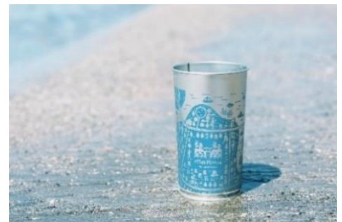
スチールカップ「MARK IS カップ」

https://www.mec-markis.jp/mm/statics/goodproject/good202510/good1.html