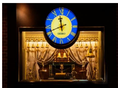
開業 10 周年を記念に設置された「からくり時計」

天神地下街のシンボルとして親しまれている「からくり時計（ヨーロッパンドリーム）」に、50 周年を記念した特別装飾を施します。半世紀の節目を祝う華やかな演出で、天神地下街全体に記念イヤーの彩りを添えます。