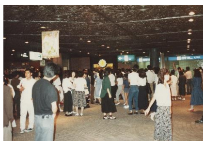
新たに設置されたからくり時計を見ようと多くのお客様でにぎわっている様子（天神地下街 10 周年当時の写真）