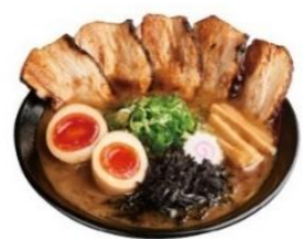
特製濃厚豚骨醤油らーめん