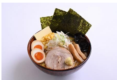
味噌ラーメンスペシャル