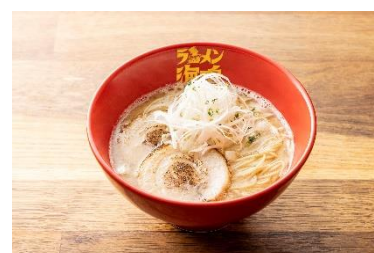
魚介とんこつラーメン