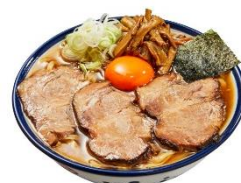
「手打ち中華 玉」 特製中華そば