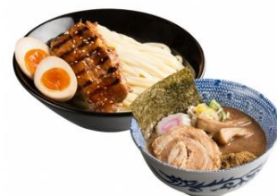
「頑者 NEXTLEVEL」 つけめん DX