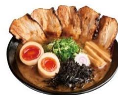
「金澤濃厚豚骨ラーメン 神仙」 特製濃厚豚骨醤油らーめん