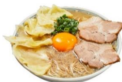
「三代目 博多 だるま」 月見ワンタンメン