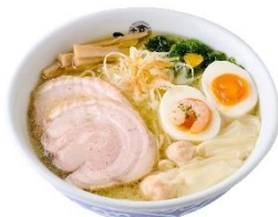
「ひるがお」 塩らーめん ひるがお盛り