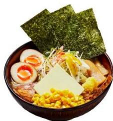
「札幌 みその」 味噌ラーメンスペシャル