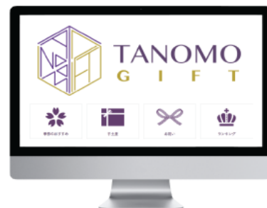
PC注文画面 イメージ