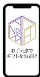
スマートフォン注文画面 イメージ