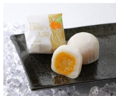
商品イメージ写真