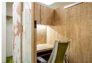
ワーキングスペース