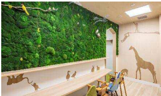
「コトフィス～こどもとはたらくオフィス～ 新国際ビル」

新国際ビル、山王パークタワー、どちらの施設も企業単位でのご利用契約をお受けしています。