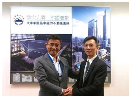
合弁契約締結時写真