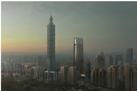
「南山広場」外観（中央）。 左は台北 101

当社は、三菱地所グループのPM会社として、多数のビルを運営管理する実績・経験を活かし、今後もグローバルにPM事業を展開していきます。